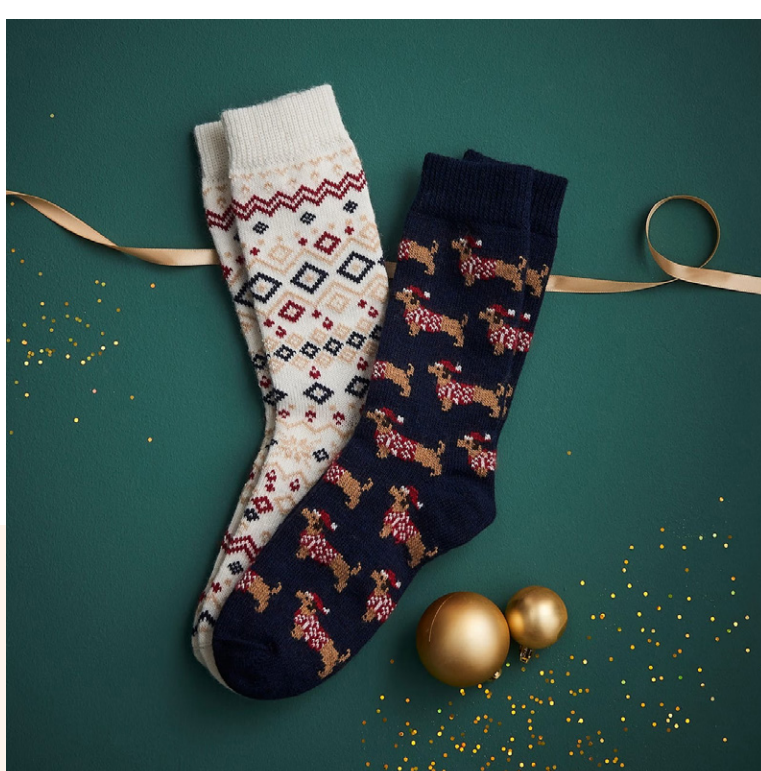
CHAUSSETTES THERMOLACTYL 2 modèles - jacquard hivernal ou chien stylisé 9.99€ la paire