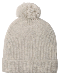
BONNET (RE)GENERATION Maille fabriquée à partir d'acrylique et de polyester recyclé. 4 coloris. 19.99€