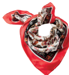
FOULARD IMPRIMÉ 100% polyester. 19.99€