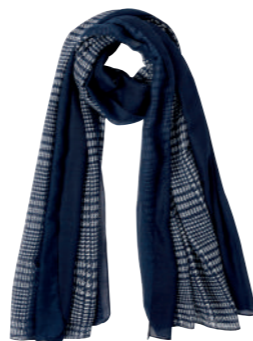
FOULARD Imprimé Prince de Galles, 100% polyester. 24.99€