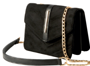
SAC À MAIN CHAÎNE NOIRE 100% polyester. 34.99€