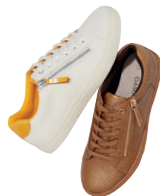
BASKETS ZIPPÉES Semelle intérieure cuir, 2 coloris, du 36 au 41. 54.99€