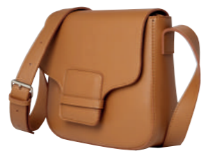
SAC À MAIN BANDOULIÈRE 100% polyuréthane. 39.99€