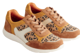
BASKETS IMPRIMÉ LÉOPARD Semelle intérieure cuir, 2 coloris, du 36 au 41. 79.99€