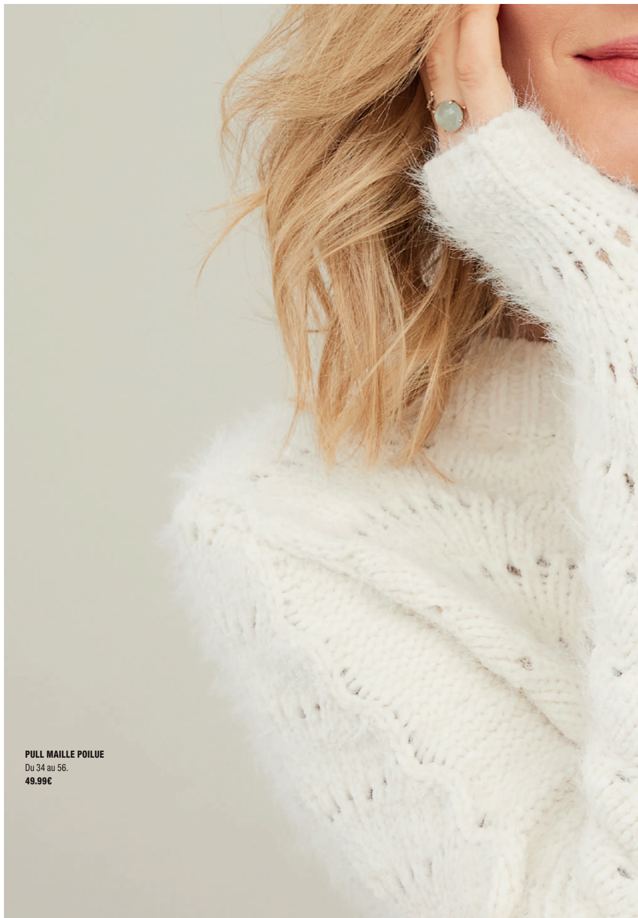
PULL MAILLE POILUE Du 34 au 56. 49.99€