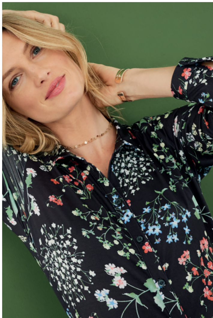
CHEMISE Imprimé fleuri, polyester (92%), élasthanne (8%), disponible en 3 coloris, du 34 au 56. 34.99€

Le blues de la rentrée, moi ? Jamais ! Les fleurs prennent le pouvoir et s'installent sur nos chemises avec des couleurs franches. Voici le remède pour un look Bonne humeur assurée !