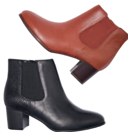
LOW BOOTS EFFET BI-MATIÈRE 2 coloris, du 36 au 41. 89.99€