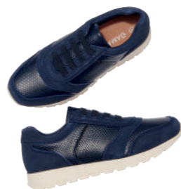
SNEAKERS DENIM (RE)GENERATION Dessus et doublure fabriqués à partir de fibres recyclées, semelle intérieure cuir, du 36 au 41. 79.99€