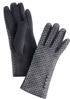
GANTS Acrylique (60%), polyester (40%). 17.99€