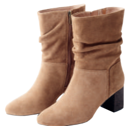
BOOTS EFFET PLISSÉ Dessus croûte de cuir vachette, du 36 au 41. 89.99€