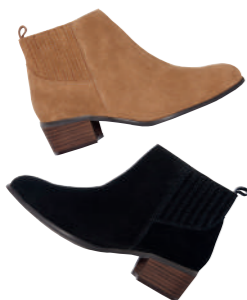
BOOTS STYLE WESTERN Dessus croûte de cuir, 2 coloris, du 36 au 41. 79.99€