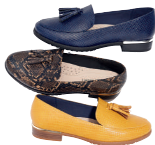
MOCASSINS ASPECT SERPENT Semelle intérieure cuir, 3 coloris, du 36 au 41. 49.99€