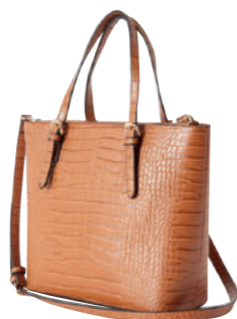
CABAS EFFET CROCO CAMEL 100% polyester. 39.99€