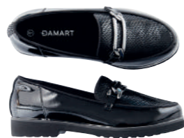
MOCASSINS CUIR NOIR Effet croco, dessus cuir vachette fine doublure Thermolactyl, du 36 au 41. 79.99€