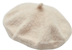
BÉRET CHAUD Mélange polyamide (81%) et polyester (19%). 19.99€