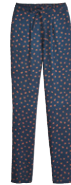
PANTALON crêpe imprimé. Du 36 au 54. 39.99€