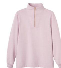
SWEAT SHIRT col camionneur. Du 34/36 au 54/56. 35.99€