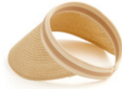
CHAPEAU visière tressée. 19.99€