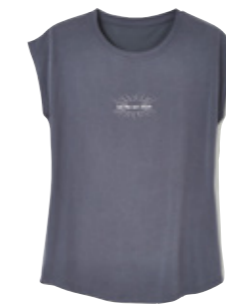
TSHIRT Climatyl. Du 38/40 au 50/52. 25.99€