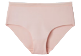
CULOTTE Climatyl. Du 38/40 au 54/56. 16.99€