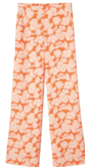
PANTALON crêpe. Du 36 au 54. 39.99€