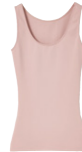
DEBARDEUR Perfect Fit by Damart. 29.99€