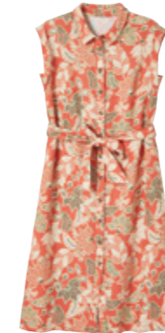
ROBE mélange lin sans manches. 55% lin, 45% viscose. Du 36 au 54. 69.99€