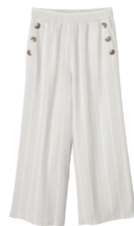
PANTACOURT à pont. Mélange lin et viscose. Du 36 au 54. 39.99€