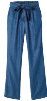
PANTALON ceinturé. Du 36 au 54. 45.99€