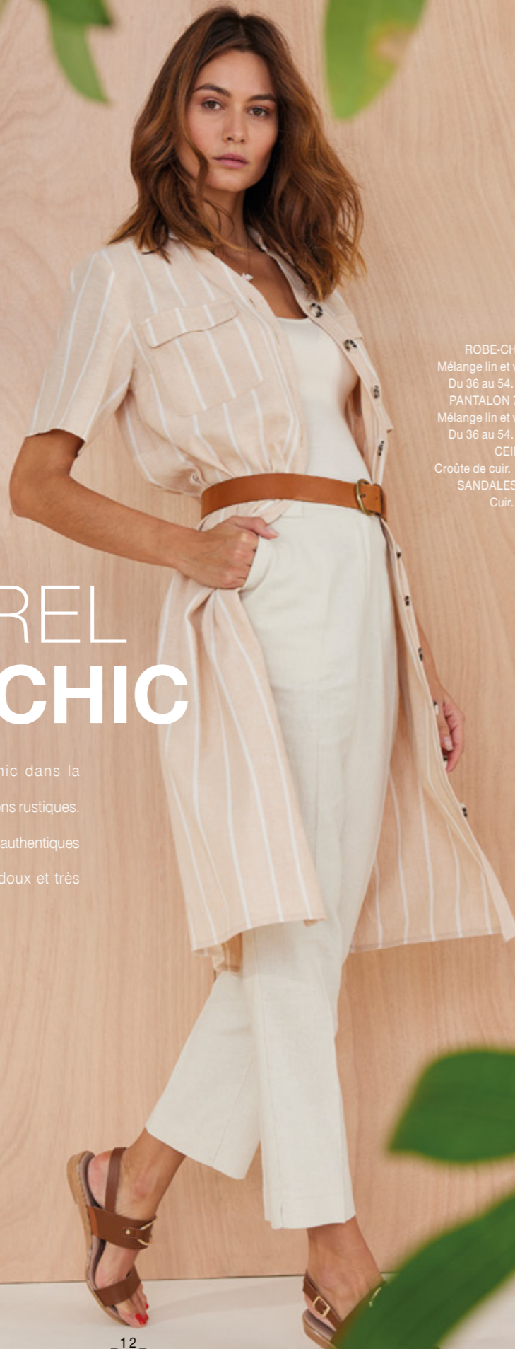
ROBE-CHEMISE. Mélange lin et viscose. Du 36 au 54. 69.99 € PANTALON 7/8ème. Mélange lin et viscose. Du 36 au 54. 39.99 € CEINTURE. Croûte de cuir. 19.99 €. SANDALES plates. Cuir. 69.99 €

On se sent légère et chic dans la simplicité des lins et des cotons rustiques. On renoue avec des matières authentiques et on adopte des coloris doux et très naturels.