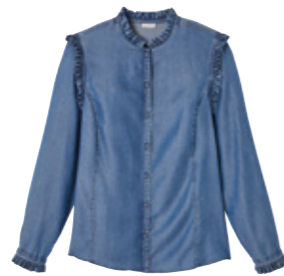
CHEMISIER à volants. Du 36 au 54. 39.99€