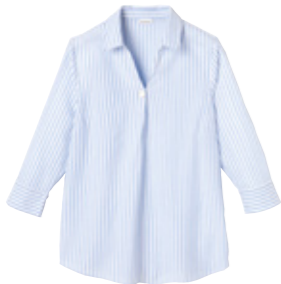
BLOUSE rayée et lurex. Du 36 au 54. 35.99€