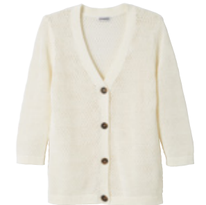
GILET ajouré en coton biologique. 100% coton. Du 34/36 au 54/56. 35.99€