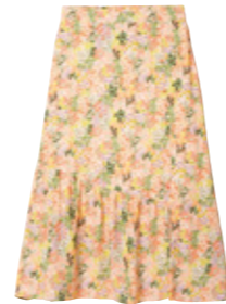
JUPE longue crêpe. Du 36 au 54. 45.99€