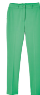
PANTALON 7/8 ème . Du 36 au 54. 45.99€