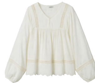
BLOUSE broderie anglaise. Du 36 au 54. 49.99€