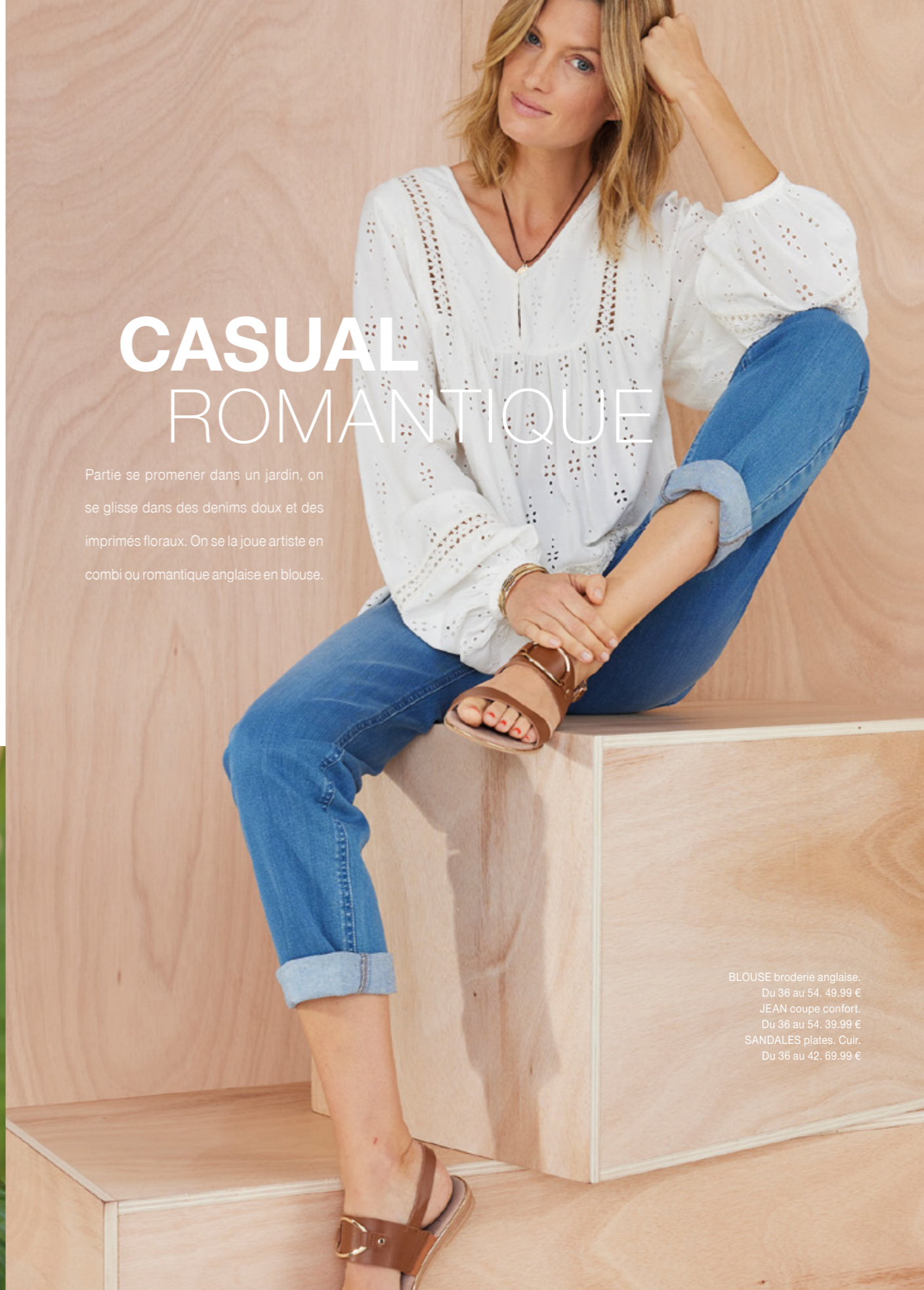
BLOUSE broderie anglaise. Du 36 au 54. 49.99 € JEAN coupe confort. Du 36 au 54. 39.99 € SANDALES plates. Cuir. Du 36 au 42. 69.99 €

Partie se promener dans un jardin, on se glisse dans des denims doux et des imprimés floraux. On se la joue artiste en combi ou romantique anglaise en blouse.