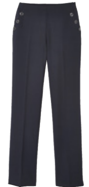
PANTALON à pont. Du 36 au 54. 49.99€