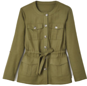
VESTE SAHARIENNE. Mélange lin et viscose. Du 36 au 54. 59.99€