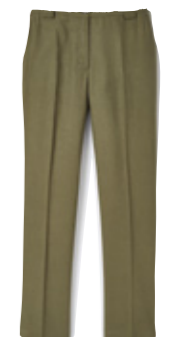
PANTALON 7/8 ème . Mélange lin et viscose. Du 36 au 54. 39.99€