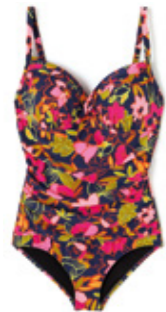
MAILLOT 1 pièce imprimé Perfect Fit by Damart. Du 38 au 52. 59.99€