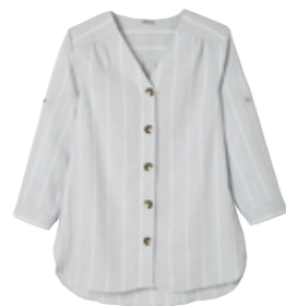
CHEMISIER TUNIQUE. Mélange lin et viscose. Du 36 au 54. 45.99€