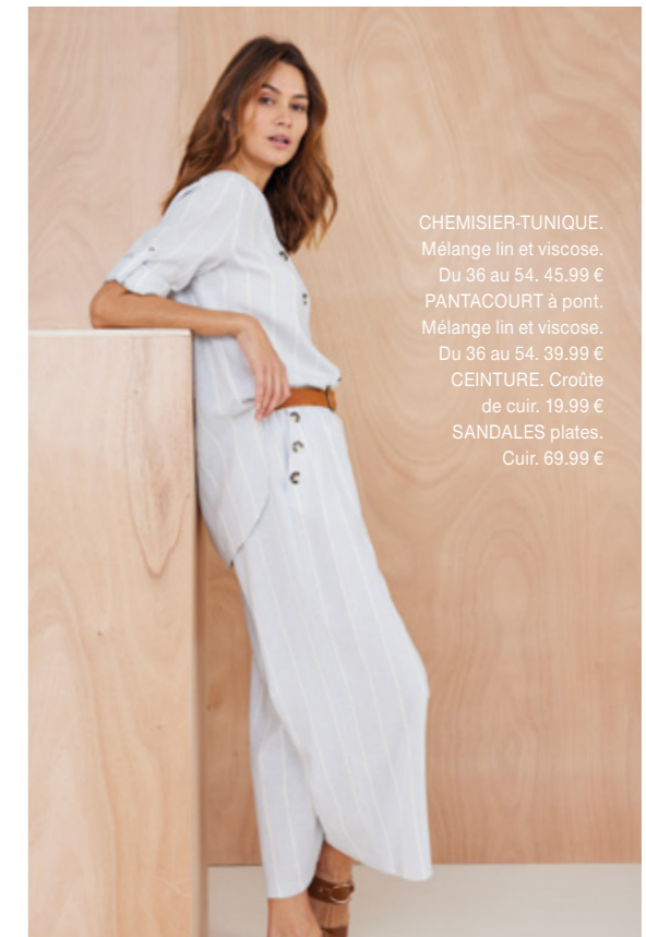
CHEMISIER-TUNIQUE. Mélange lin et viscose. Du 36 au 54. 45.99 € PANTACOURT à pont. Mélange lin et viscose. Du 36 au 54. 39.99 € CEINTURE. Croûte de cuir. 19.99 € SANDALES plates. Cuir. 69.99 €