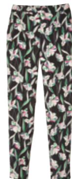
PANTALON fleuri. Du 36 au 54. 35.99€