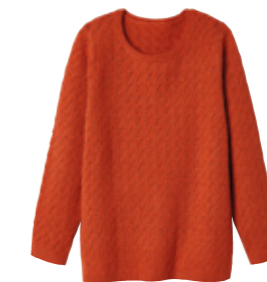
PULL maille ajourée issu d'une démarche éco-responsable. 100% polyester recyclé. Du 34/36 au 54/56. Existe en 6 coloris. 39.99€