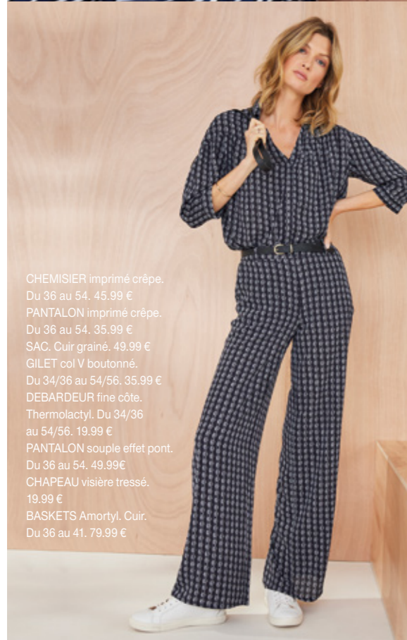
CHEMISIER imprimé crêpe. Du 36 au 54. 45.99 € PANTALON imprimé crêpe. Du 36 au 54. 35.99 € SAC. Cuir grainé. 49.99 € GILET col V boutonné. Du 34/36 au 54/56. 35.99 € DEBARDEUR fine côte. Thermolactyl. Du 34/36 au 54/56. 19.99 € PANTALON souple effet pont. Du 36 au 54. 49.99 € CHAPEAU visière tressé. 19.99 € BASKETS Amortyl. Cuir. Du 36 au 41. 79.99 €