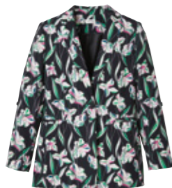
VESTE imprimée en satin mat. Du 36 au 54. 59.99€