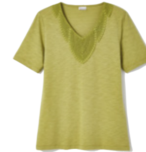
TSHIRT mélange coton biologique. 75% coton, 25% modal. Du 34/36 au 54/56. 25.99€