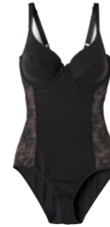
BODY sculptant avec armatures Perfect Fit by Damart. Plastron ventral doublé tulle. Du 90 au 115. Bonnet B à D. 59.99€