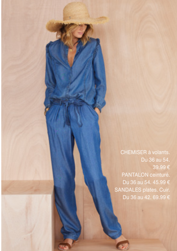
CHEMISER à volants. Du 36 au 54. 39.99 € PANTALON ceinturé. Du 36 au 54. 45.99 € SANDALES plates. Cuir. Du 36 au 42. 69.99 €