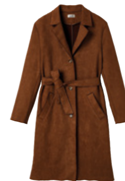
MANTEAU suédoine. Du 36 au 54. 89.99€