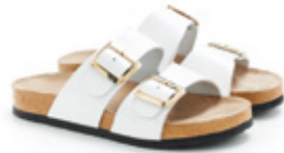
MULES. Cuir. Du 36 au 42. 69.99€