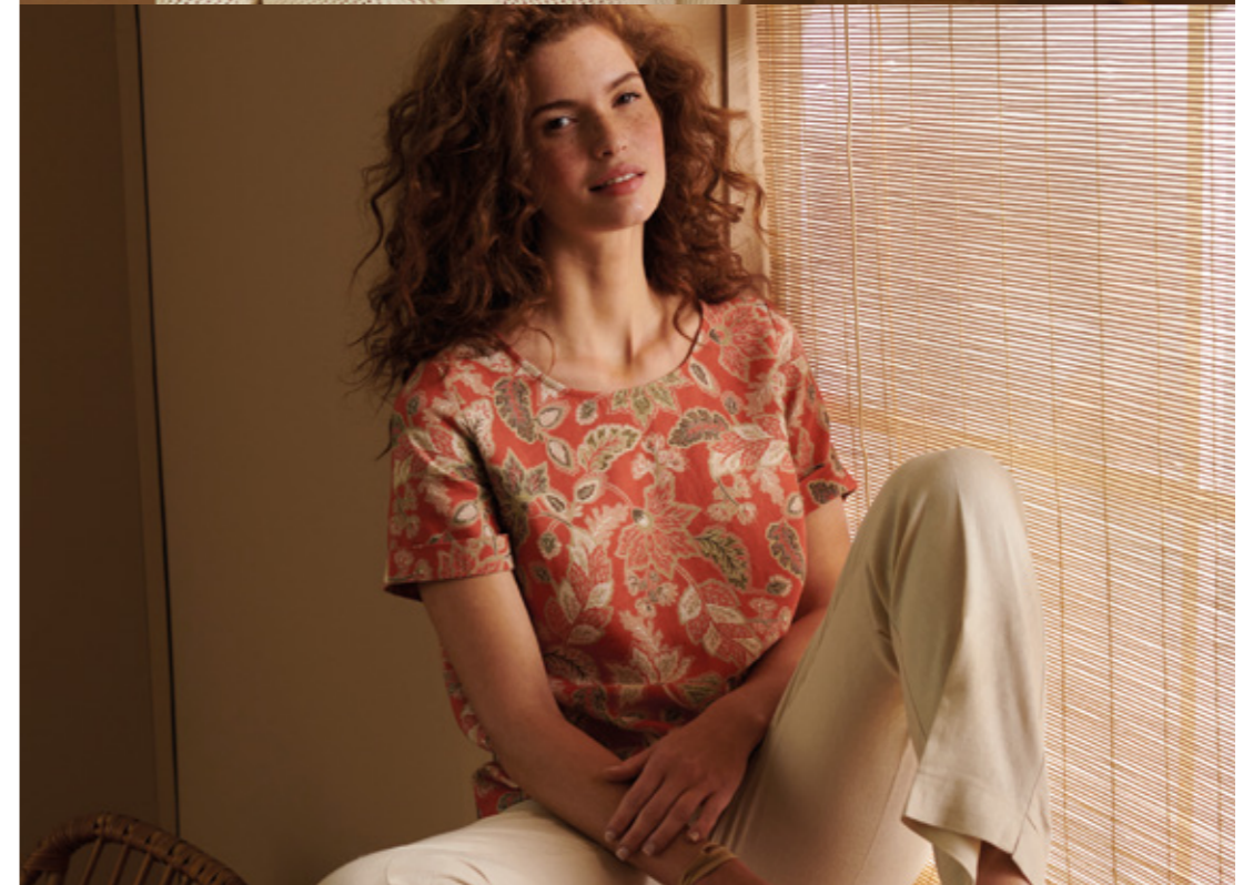
TSHIRT mélange coton biologique. 75% coton, 25% modal. Du 34/36 au 54/56. 25.99€ PANTALON 7/8 ème mélange lin. 55% lin, 45% viscose. Du 36 au 54. 39.99€ GILET ajouré en coton biologique. 100 % coton. Du 34/36 au 54/56. 35.99€ BLOUSE mélange lin fleurie. 55% lin, 45% viscose. Du 36 au 54. 39.99€ PANTALON 7/8 ème mélange lin. 55% lin, 45% viscose. Du 36 au 54. 39.99€