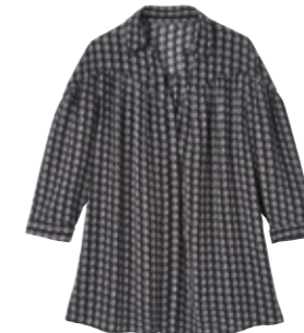
CHEMISIER imprimé crêpe. Du 36 au 54. 45.99€