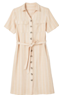
ROBE CHEMISE. Mélange lin et viscose. Du 36 au 54. 69.99€