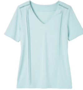
TSHIRT Climatyl. Du 34/36 au 54/56. 25.99€