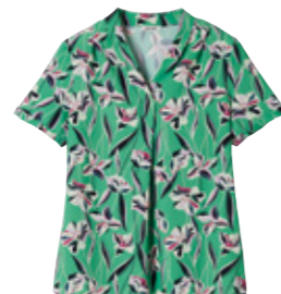
BLOUSE imprimée crêpe. Du 36 au 54. 29.99€