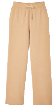
PANTALON large maille côtelée. Du 34/36 au 54/56. 39.99€