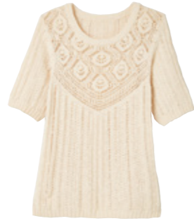
PULL effet crochet. Coton. Du 34/36 au 54/56. 39.99 €