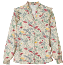
CHEMISIER imprimé. Du 36 au 54. 45.99€