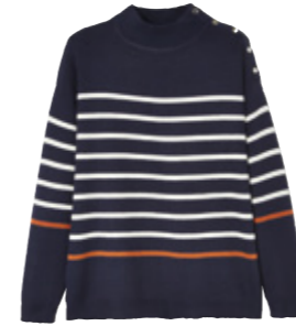
MARINIÈRE pressions épaule. Thermolactyl. Du 34/36 au 54/56. 39.99€