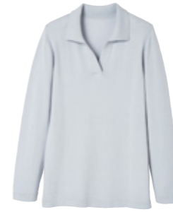
PULL fine maille Thermolactyl. Du 34/36 au 54/56. 39.99€