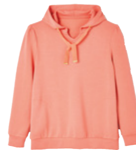
SWEAT SHIRT toucher doux. Du 34/36 au 54/56. 39.99€