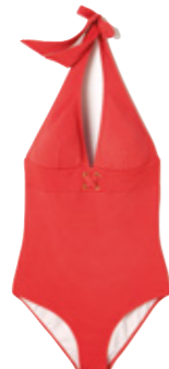
MAILLOT Perfect Fit by Damart. Du 36 au 52. 59.99€