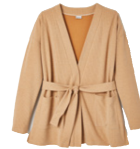
GILET côtelé stretch ceinturé. Du 34/36 au 54/56. 39.99€