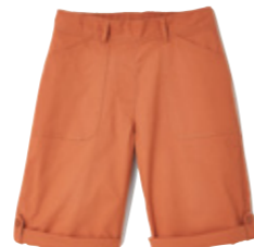
BERMUDA. Du 36 au 54. 29.99€