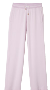
PANTALON de détente. Du 34/36 au 54/56. 39.99€