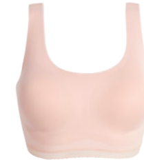
BRASSIERE Climatyl. Du 38/40 au 50/52. 29.99€