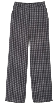
PANTALON imprimé crêpe. Du 36 au 54. 35.99€