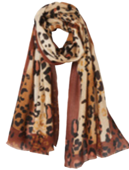
FOULARD imprimé léopard. 25.99€