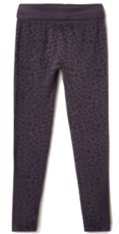
LEGGING 7/8 ème maille texturée Climatyl. Du 38/40 au 50/52. 39.99€